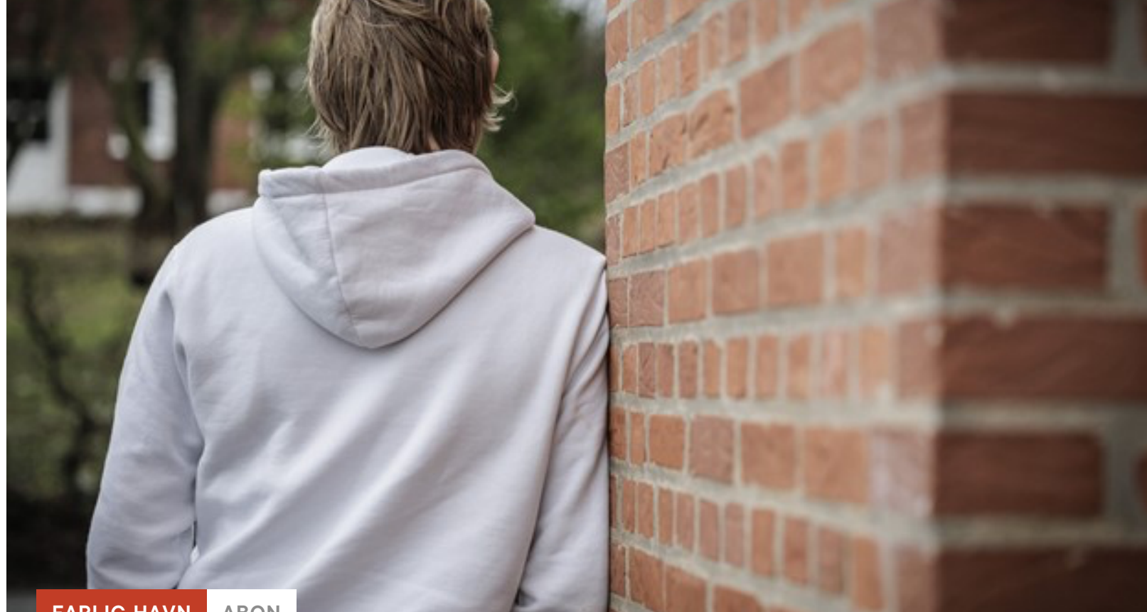
FARLIG HAVN ABON