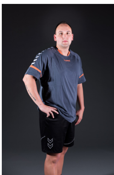
Co - Norbert Antal